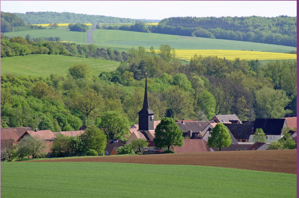
05. Mai 2005, Blick über Billingshausen

Gemeindebrief der Evang.-Luth. Kirchengemeinde Billingshausen