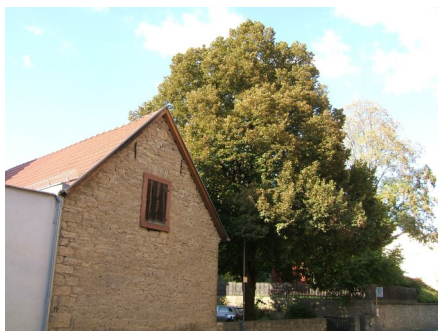
Linde / Bergahorn